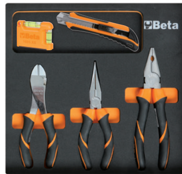
MC131 (+1771BM +1695XS)