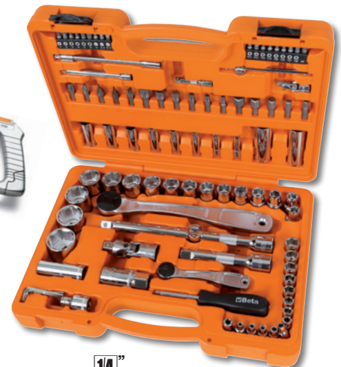
1/4" 1/2" 903A-E/C93