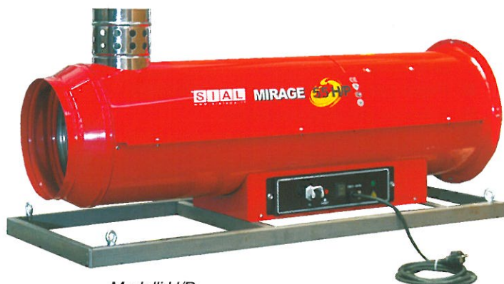
Modelli H/P in versione pensile (senza serbatoio e carrello).